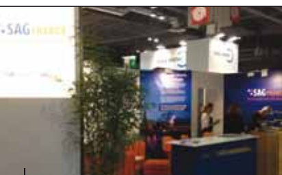
Stand SAG France au SMCL.

Pour sa première participation au plus grand salon dédié aux élus locaux, le Groupe a illustré sa proximité avec ses clients et partenaires publics, mais également réaffirmé ses ambitions par le déploiement d'offres nouvelles répondant aux attentes de ses clients dans les domaines de l'éclairage public, de la fibre optique et de la « ville intelligente ».